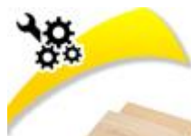
Planchettes de bois