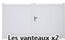
Les vantaux x2